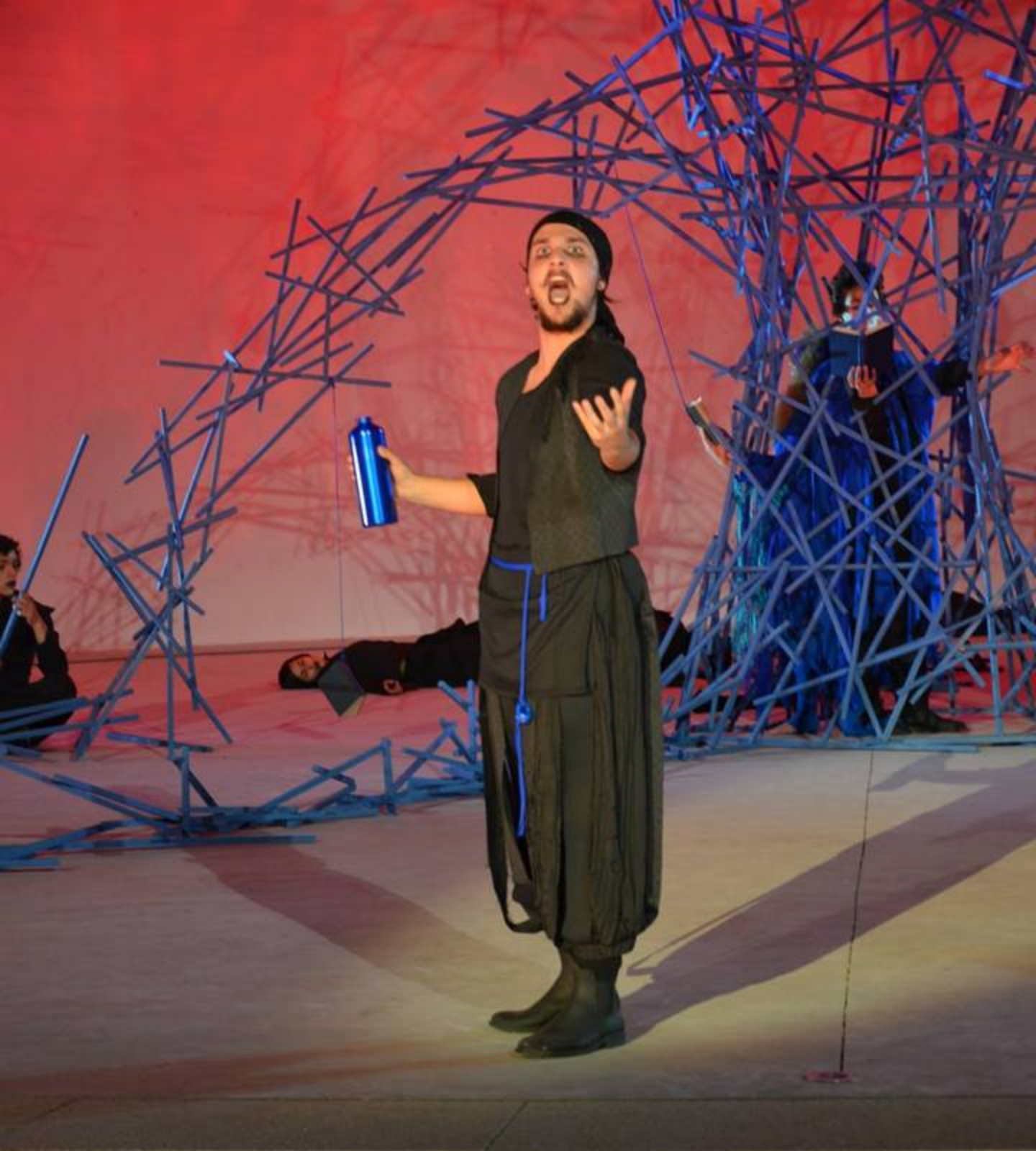
2013 | A Tempestade de W. Shakespeare Encenador Gonalo Amorim | Concha Acústica