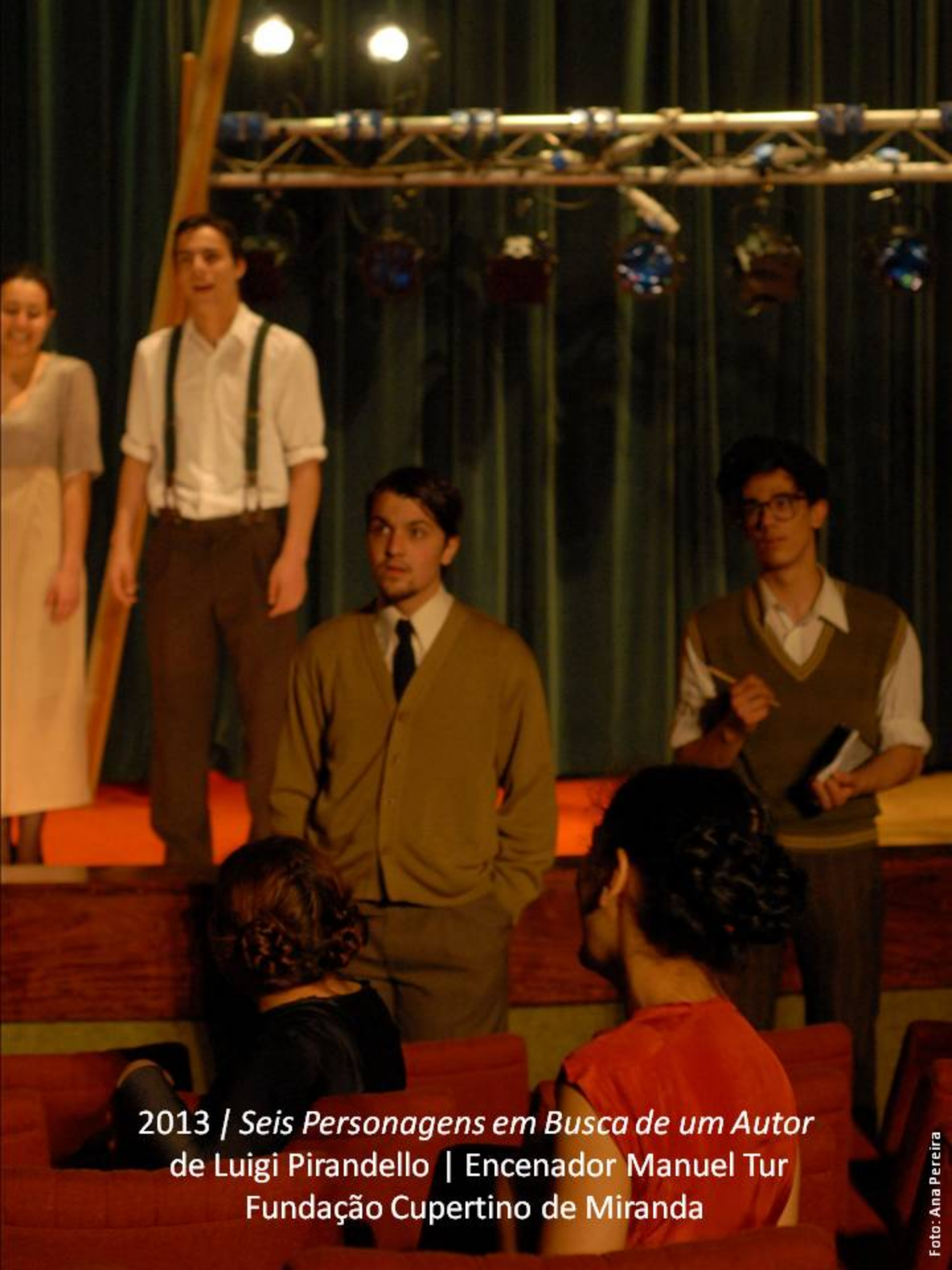
2013 / Seis Personagens em Busca de um Autor de Luigi Pirandello | Encenador Manuel Tur Fundação Cupertino de Miranda