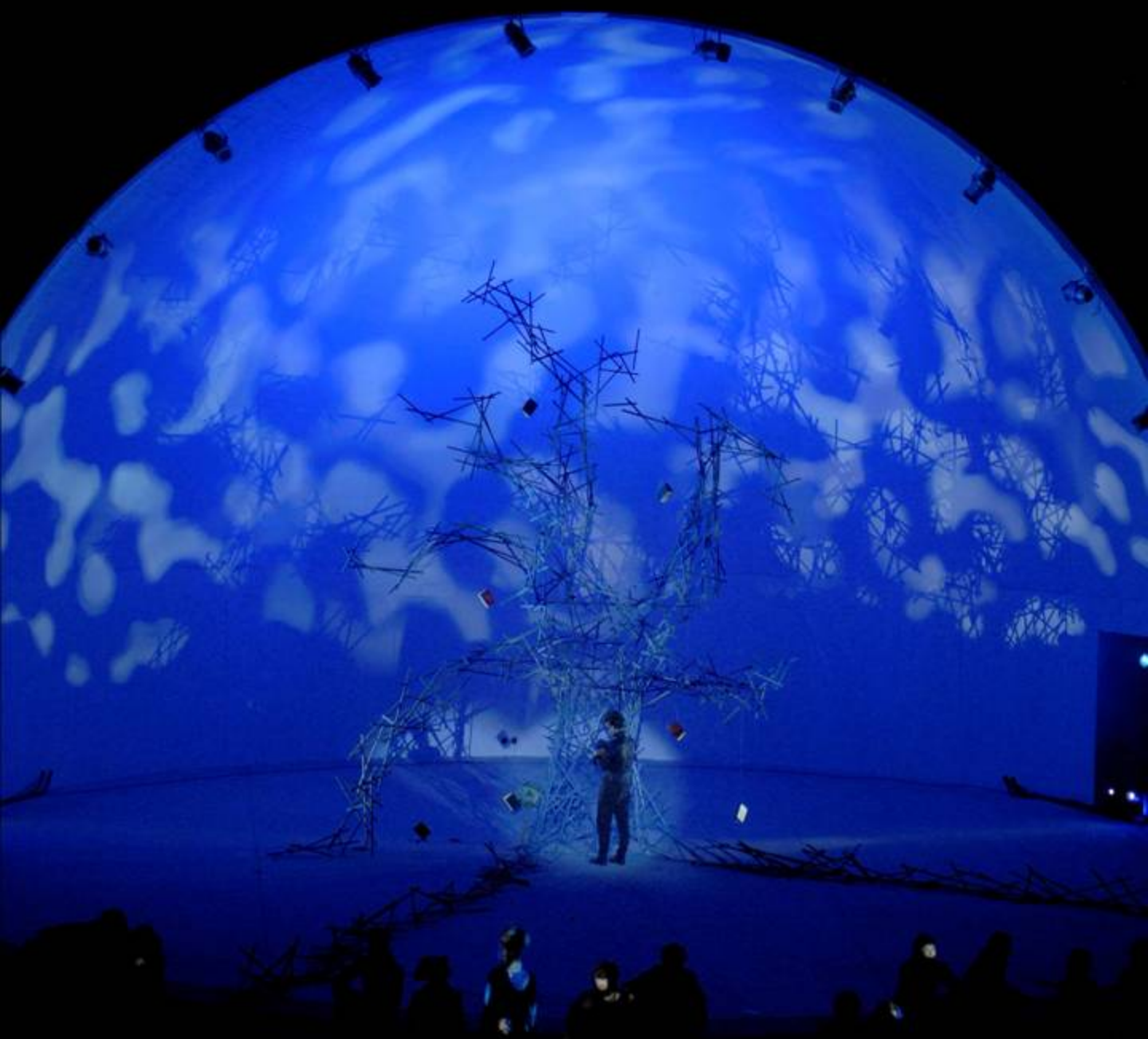
2013 | A Tempestade de W. Shakespeare Encenador Gonalo Amorim | Concha Acústica