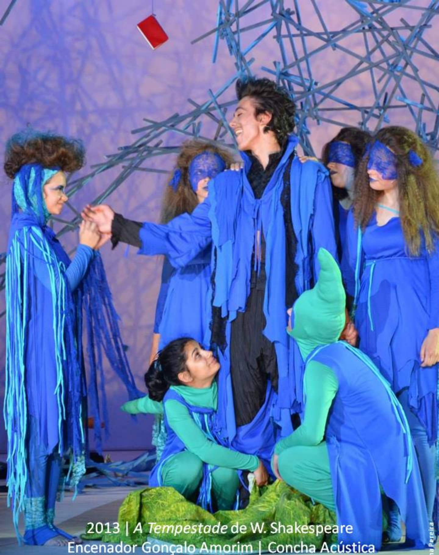
2013 | A Tempestade de W. Shakespeare Encenador Gonçalo Amorim | Concha Acústica