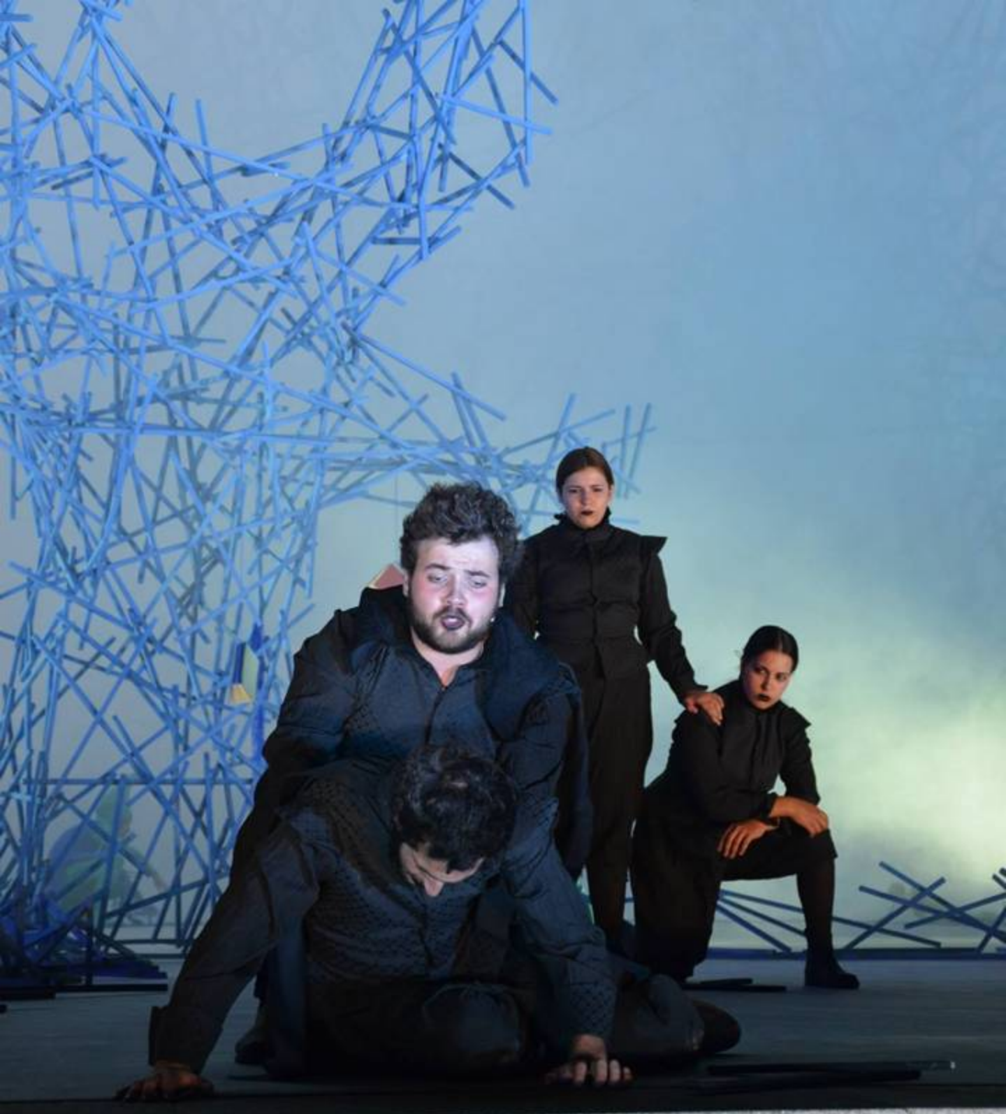
2013 | A Tempestade de W. Shakespeare Encenador Gonalo Amorim | Concha Acústica