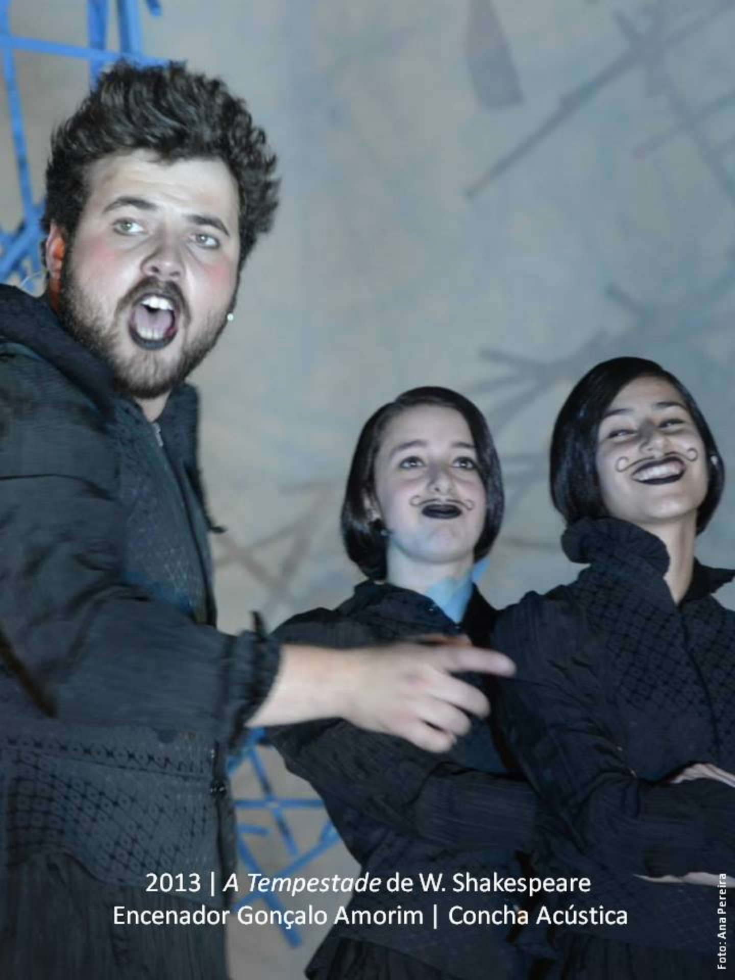
2013 | A Tempestade de W. Shakespeare Encenador Gonçalo Amorim | Concha Acústica