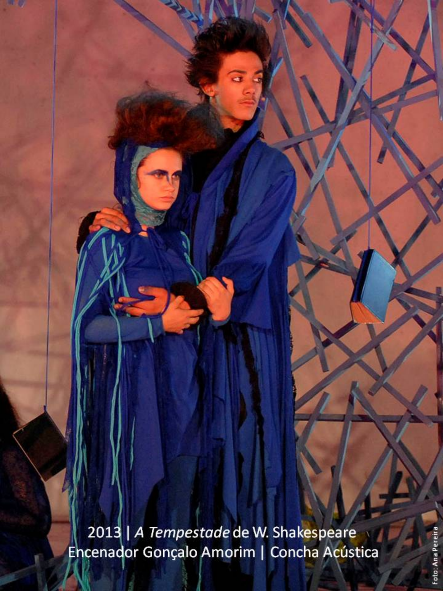
2013 | A Tempestade de W. Shakespeare Encenador Gonçalo Amorim | Concha Acústica